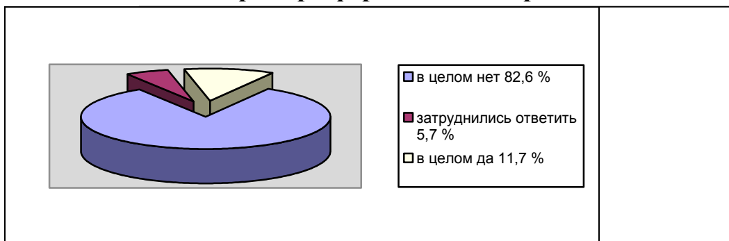
Рис. 1.1. Мнение опрошенных в 2012 г. о том, является ли .....